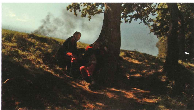
«Wunderhorn» de Clara Pons © Clara Pons

qui existent à ce jour uniquement dans leur version originale avec piano.